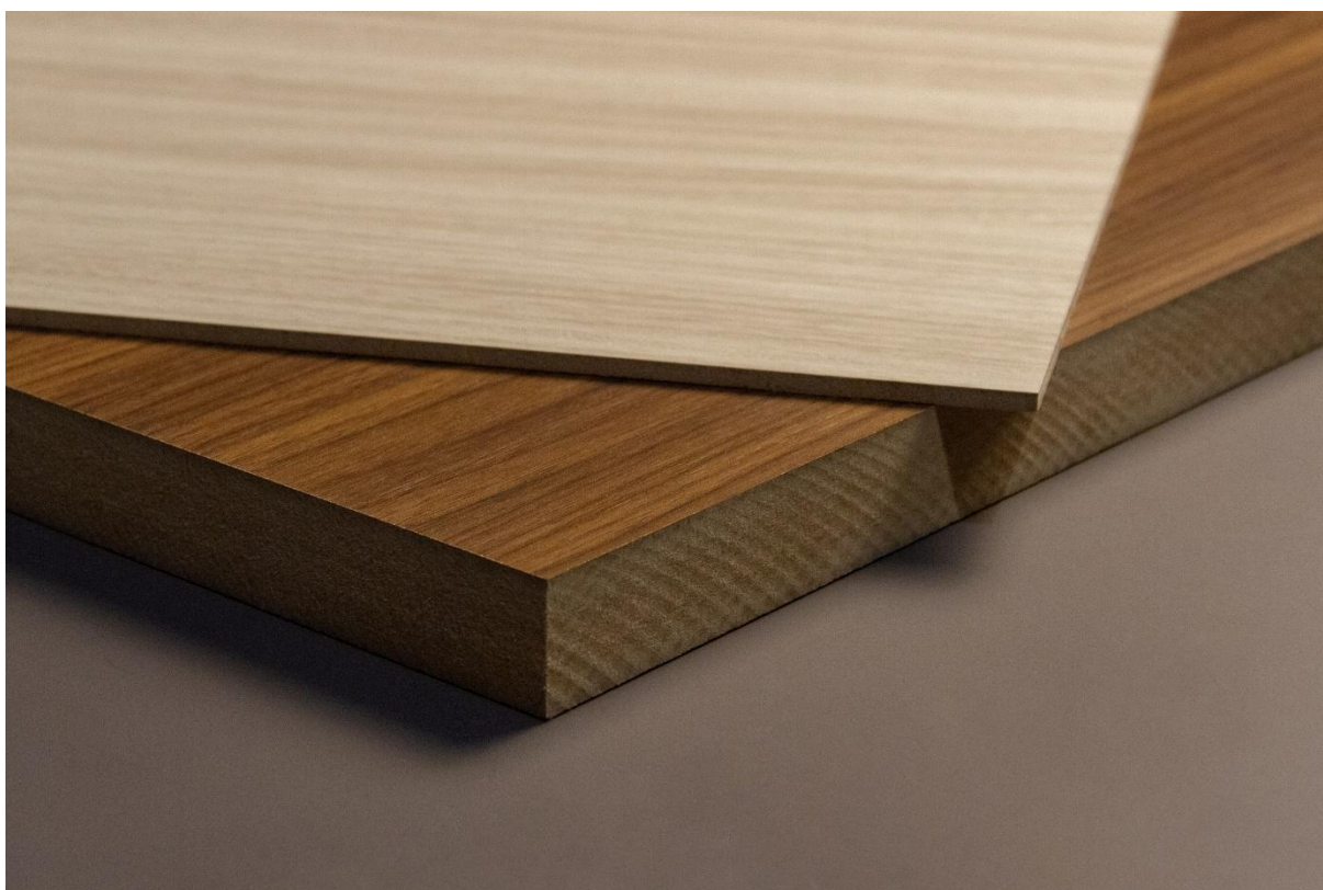
Figura 1 - Rappresentazione visiva del prodotto

L'azienda offre oltre 60 finiture caratterizzate da una struttura tridimensionale, ottenuta mediante l'uso di lamiere di pressatura incise per i pannelli nobilitati, rotoli di release per i laminati e goffatura meccanica per i bordi. Le finiture possono essere abbinate a oltre 800 carte decorative, in gran parte progettate da Cleaf, impregnate con resine termoindurenti a base d'acqua. Le carte decorative possono essere tinte unite pigmentate in pasta oppure stampati ottenuti mediante stampa a rotocalco o digitale. Questo prodotto è progettato per l'impiego nella realizzazione di arredi per interni, allestimenti e prodotti da costruzione non portanti. La gamma comprende articoli specifici con resistenza migliorata all'umidità o al fuoco. Non è destinato all'uso in ambienti esterni.